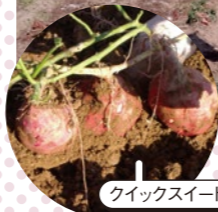
クイックスイート